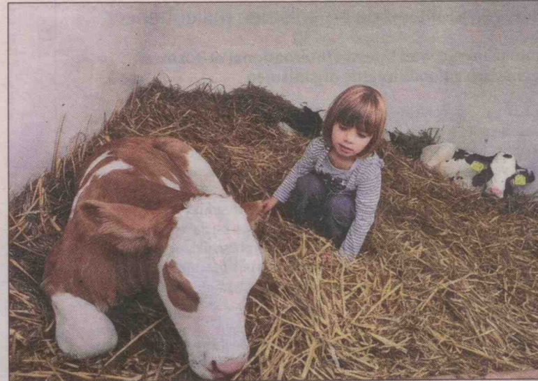
Kalveren liggen ontspannen in het hooi bij boerderij Buitengast in Persingen. De jonge dieren zijn geliefd bij jonge kinderen.