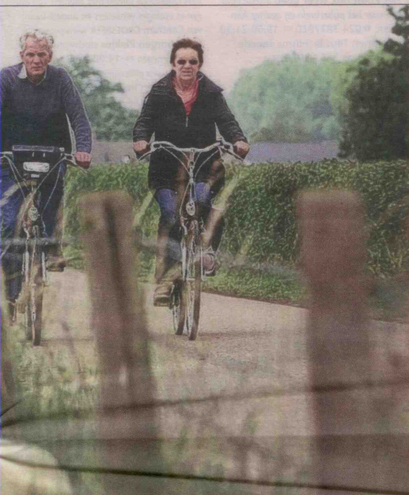
Fietsen rond Overasselt, of op andere plekken rond Nijmegen: duizenden mensen deden het zondag tijdens het Streekgala.