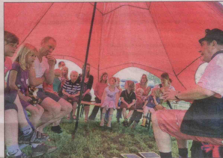
De verhalenverteller brengt in Persingen agrarische volksverhalen tot leven.